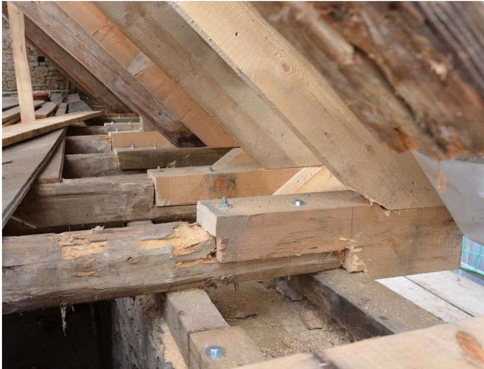
Abbildung 4: Austausch der Balkenköpfe, hier auf der Nordseite.