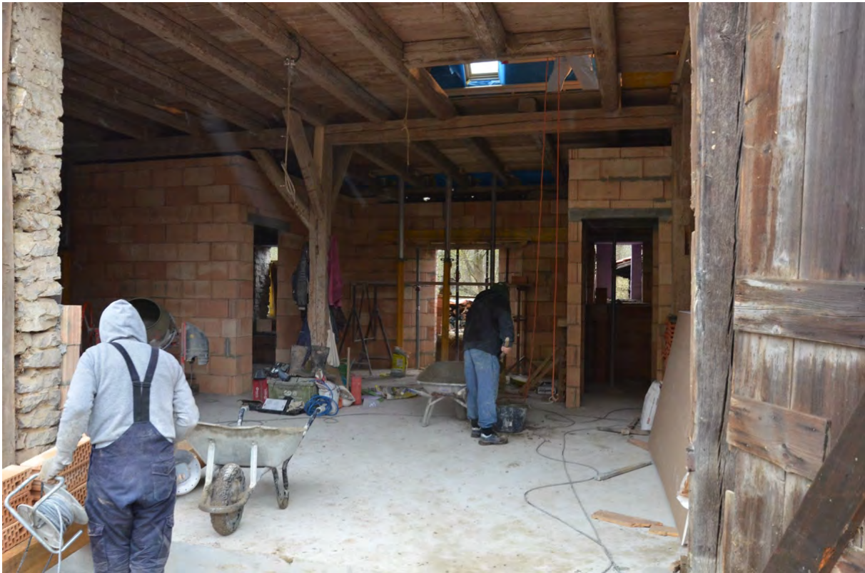
Abbildung 8: Blick in den Scheuneninnenraum nach Erstellung der Innenwände. Tenne & Balkenwerk im Originalzustand.

Zunächst wurde daher die Bodenplatte in den Innenraum der Scheune eingegossen, derart, dass eine statische Absicherung des Fundamentes durch eine zusätzlich in das ursprüngliche Fundament eingefügte Stahlverankerung erfolgt ist (Details siehe Baugesuch).