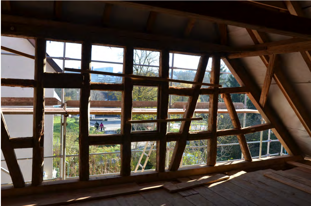
Abbildung 25: Freigelegtes Fachwerk im Ostgiebel von Innen.