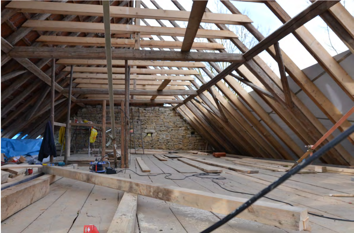
Abbildung 6: Beplankung im Bereich der Sparren soweit Einzug der Decke des Obergeschosses.