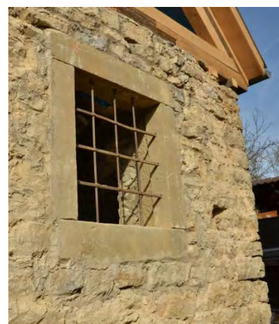
Abbildung 9: Sandsteingewände nach der Umsetzung von der West zur Ostwand von Innen und Außen.