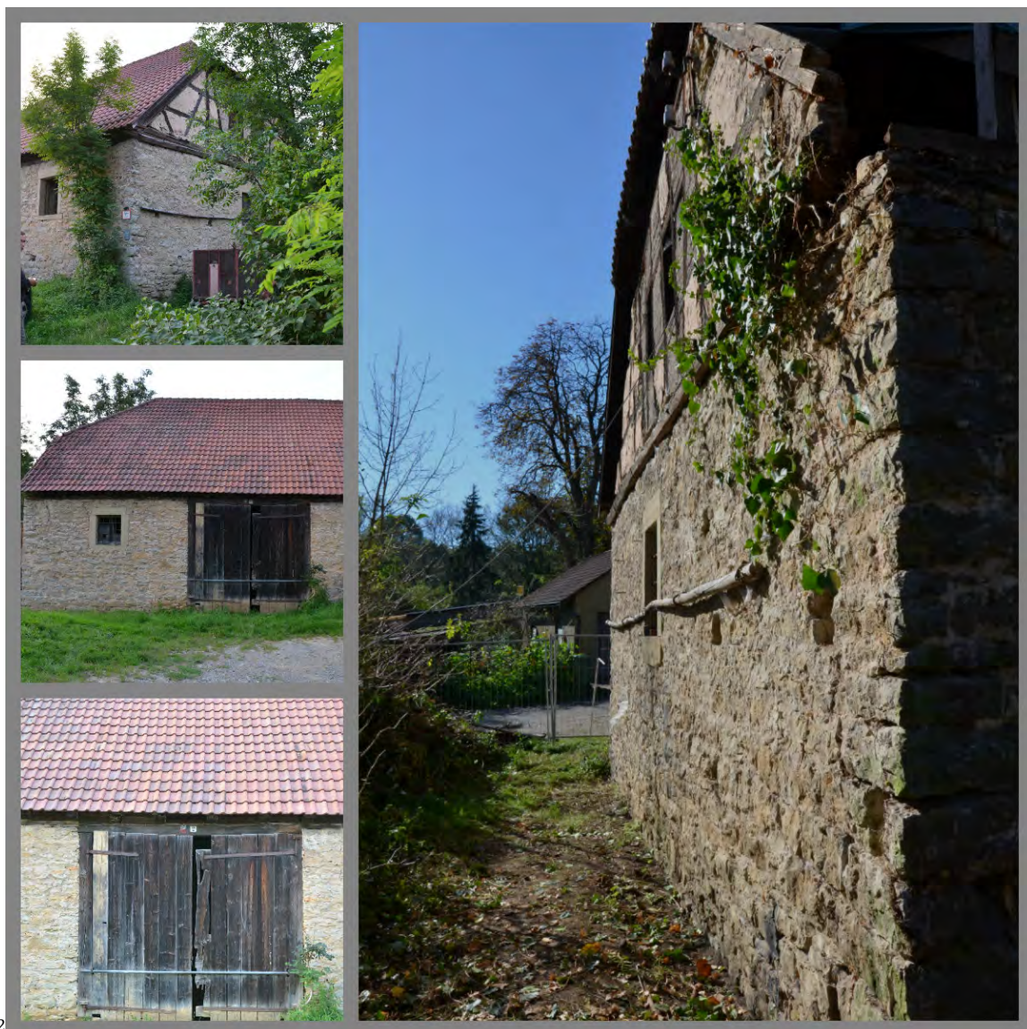
Abbildung 1: Gebäude vor Baubeginn von Außen.

Der Schafstall wurde in Bruchsteinmauerwerk gebaut, mit einem Krüppelwalmdach und einem liegenden Dachstuhl. Die Außenansicht entspricht der eines zeitgemäßen Tierhaltungsgebäudes mit einem hölzernen Scheunentors mittig zur Traufseite. Dies gilt auch für die innere Teilung in Tenne und seitliche Flächen. Beide Mittelstützen stehen auf knappen Sandsteinsockeln mit Punktfundamenten. Die filigrane Dachkonstruktion trägt das Dach mittels 2 abtragenden Dachstühlen (links/rechts). Das Dach war mit Strangfalzziegeln gedeckt.