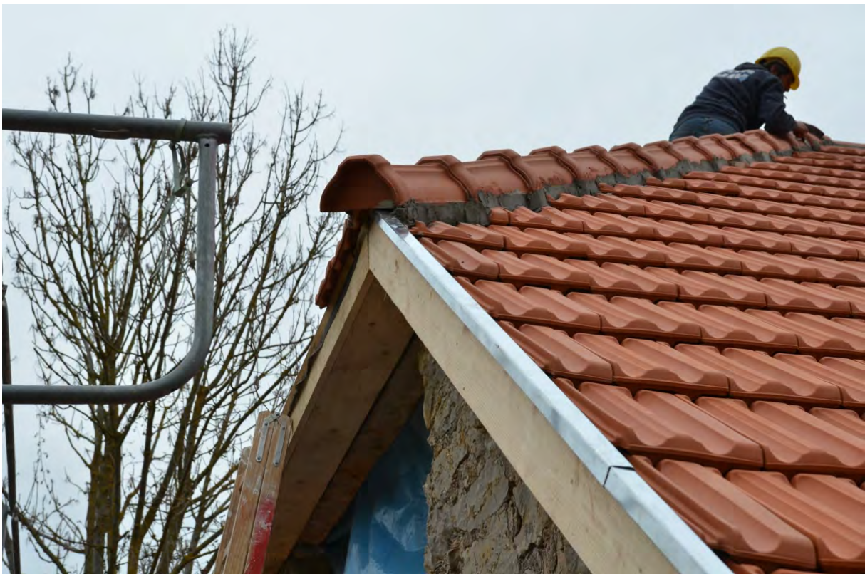
Abbildung 7: Stirnseitiger Abschluss des Dachstuhls mit einfachen Bohlen, abgedeckt mit Zinkblech.