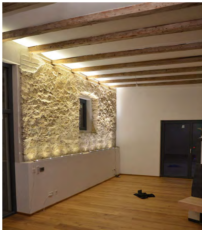
Abbildung 30: Belichtungskonzept zur adäquaten Inszenierung der alten Scheunenelemente.

Nicht zuletzt wird durch Beleuchtungselemente die historische Struktur im neuen Wohnkonzept integriert, z.B. die Bruchsteinmauer im Wohnzimmer oder der alte Dachstuhl im OG.