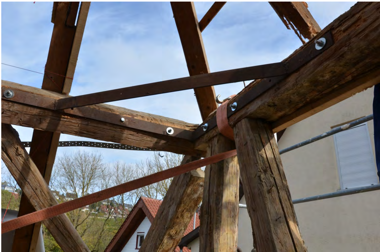
Abbildung 5: Absicherung des Tragwerks im Bereich des Ostgiebels.