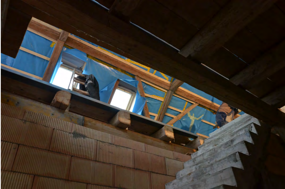
Abbildung 21: Geöffnetes Gebälk zur Durchführung der Treppen in das Obergeschoss.