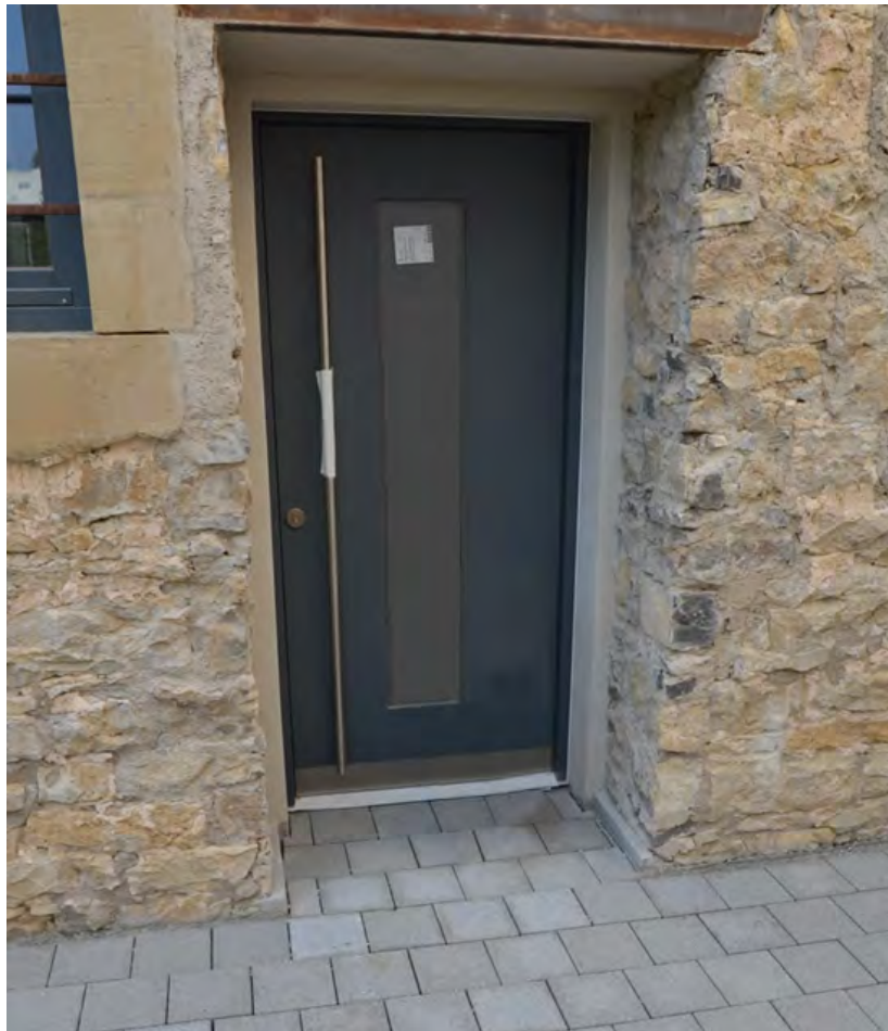
Abbildung 20: Haustür in eisengrau mit rostigem Stahlsturz.

Im ursprünglichen Zustand bestand die Verbindung aus Tenne und Scheune im untere Bereich lediglich über eine Leiter und einer entsprechenden Lastenöffnung (heute liegt diese über dem Essbereich und ist durch die zwei zusätzlichen Querbalken nach wie vor sichtbar). Für die neue