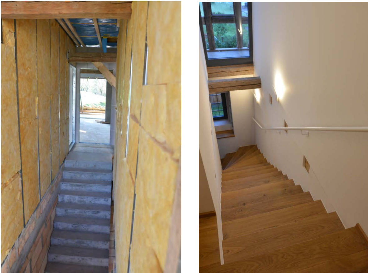
Abbildung 22: links: Treppenhaus im Rohbau; rechts: Blick nach Osten durch das Fachwerk.

Die im Bereich des Dachstuhls an der Ostseite befindliche Fachwerkstruktur sollte nicht nur erhalten werden, sondern in Ihrer Form betont und mit der geraden Designlinie in Verbindung gebracht werden. Aus diesem Grund fiel die Entscheidung für das Freistellen der alten Balken und einer um ca. 60 cm zurückgesetzten Fensterfront. Dadurch entstand ein kleiner Austritt, welcher gleichzeitig im Obergeschoss großzügige Fensterflächen erlaubte, ohne erforderliche Eingriffe in die alte Konstruktion. Neben den nach außen unverputzten Feldsteinwänden trägt dieses Element maßgeblich dazu bei, dass die Scheune in Ihrem einfachen äußerlichen Erscheinungsbild erhalten bleibt.