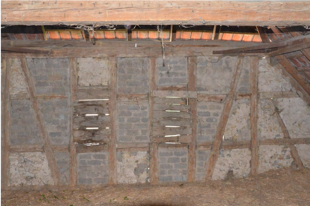
Abbildung 23: Ursprünglicher Zustand des Fachwerks im Ostgiebel von Innen.