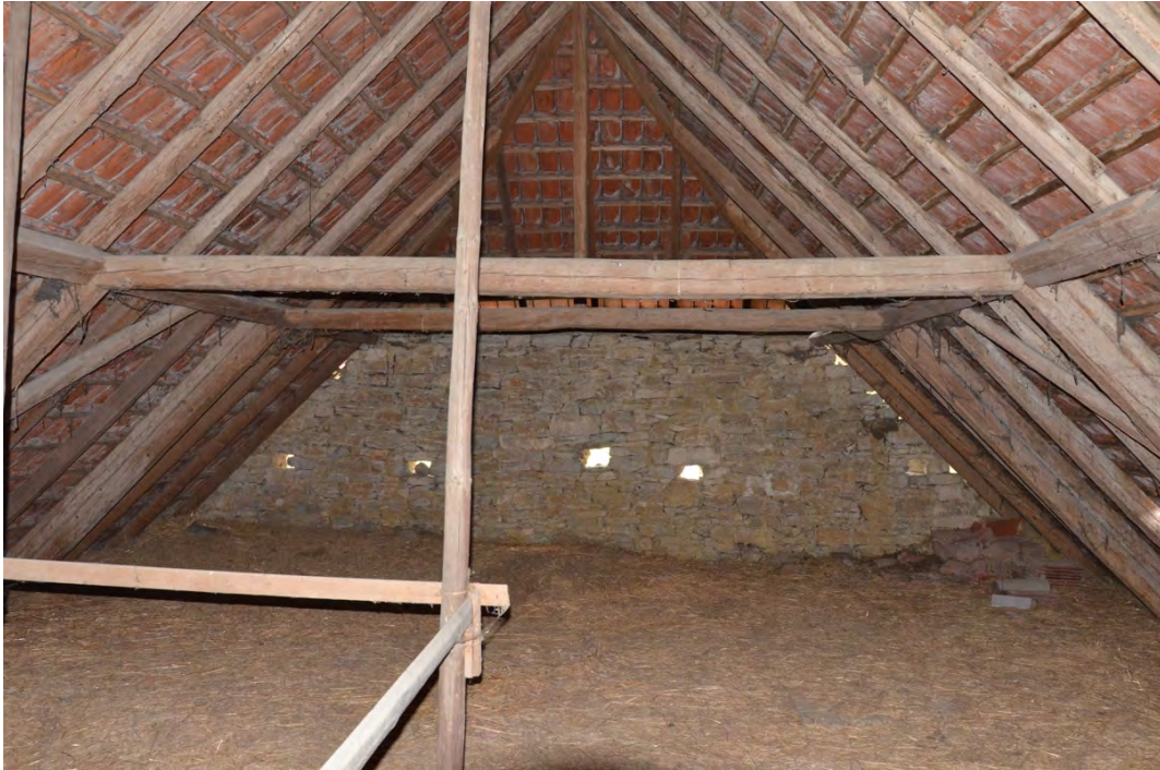
Abbildung 27: Zustand des Dachstuhls vor der Sanierung.