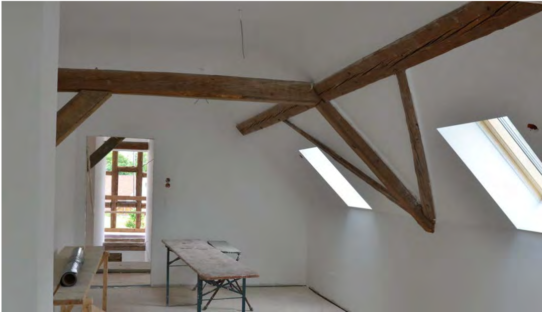
Abbildung 29: Elemente des Dachstuhls bleiben sichtbar in den Wohnräumen mit Blick zum offenen Fachwerkgiebel

Nicht zuletzt wird durch Beleuchtungselemente die historische Struktur im neuen Wohnkonzept integriert, z.B. die Bruchsteinmauer im Wohnzimmer oder der alte Dachstuhl im OG.