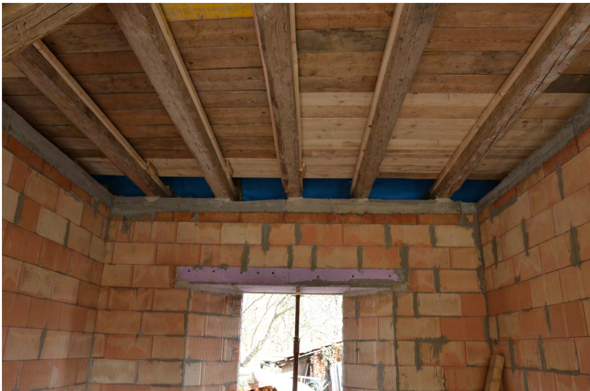
Abbildung 13: Verbindung der Deckenbalken mit dem neuen Mauerwerk über einen Betonring. Erhalt der alten Tennendielen hinter der Verschalung der Balkenzwischenräume.

Im Innenraum wurden mit Porotonziegeln die Raumstrukturen erstellt und mittels eines durchgängigen Betonrings mit der bestehenden Balkenträgerstruktur verbunden.