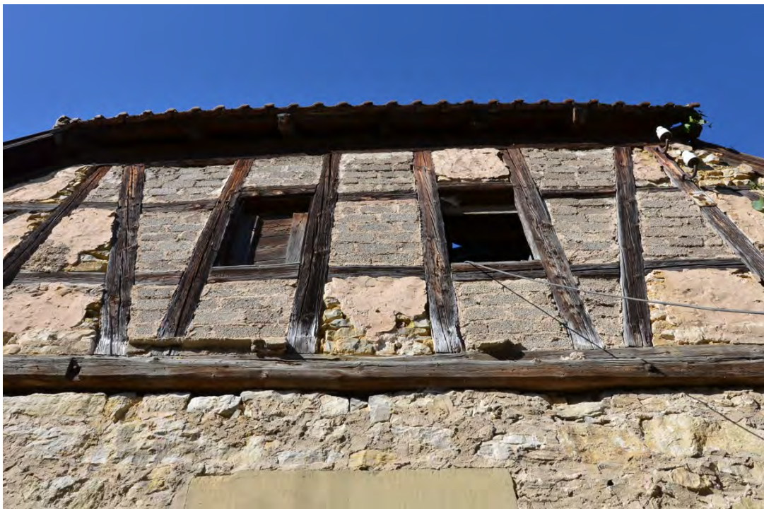
Abbildung 24: Ursprünglicher Zustand des Fachwerks im Ostgiebel von Außen.