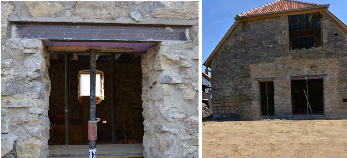
Abbildung 12: Ansicht der verwendeten Stahlstürze und Gesamtsicht der fertigen Durchbrüche der Westwand.

Im Innenraum wurden mit Porotonziegeln die Raumstrukturen erstellt und mittels eines durchgängigen Betonrings mit der bestehenden Balkenträgerstruktur verbunden.