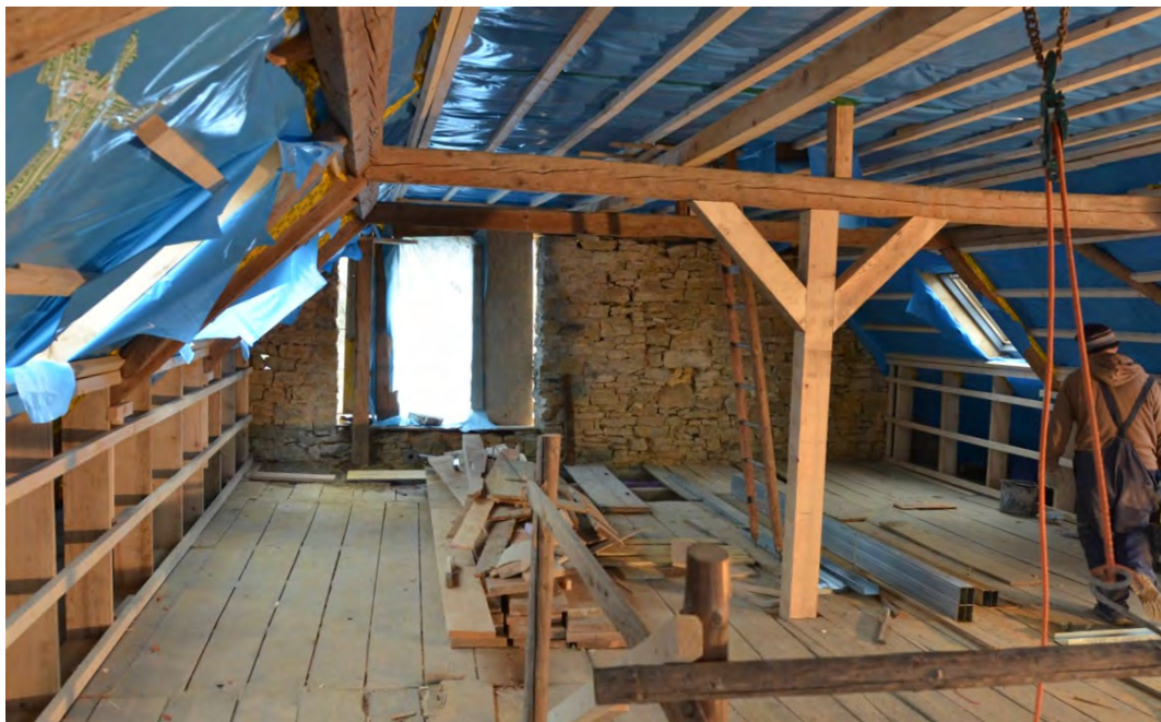
Abbildung 28: Dachstuhl während der Sanierung.