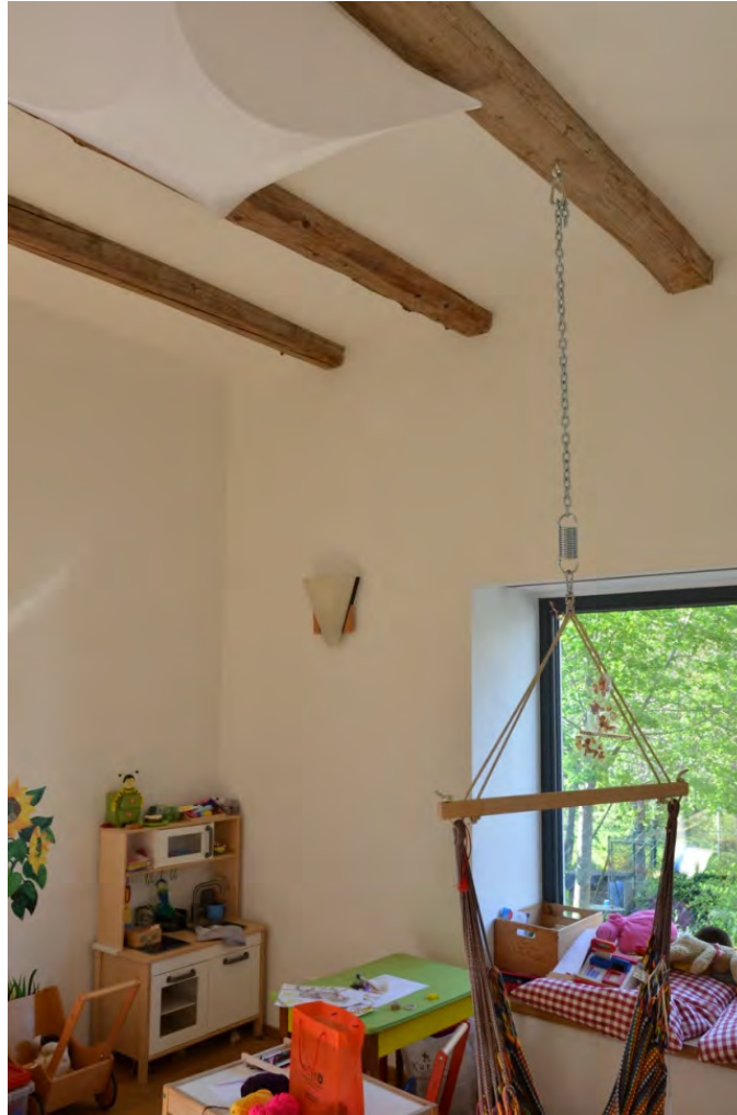
Abbildung 15: Kinderspielzimmer mit offener Balkenstruktur und Sitzfenster ins Glemstal.