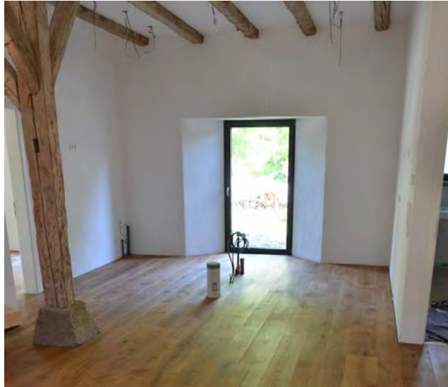
Abbildung 17: Blick nach Norden in den Küchenbereich

Um dem historischen Anspruch des Gebäudes gerecht zu werden, wurde von der Designlinie entschieden, keine alten Elemente aus anderen Häusern zu übernehmen. Alle neuen Elemente wurden nach einer klaren Designlinie ausgewählt, welche an den Grundgedanken des Bauhauses angelehnt ist. Aus diesem Grund sind nur zwei Arten von Böden im ganzen Haus zu finden. Alle Wohn-, Schlaf- und Arbeitsräume sind mit deutschen Eichendielen ausgelegt. Dieses Material findet sich auch in den Abdeckungen der Vormauerung im Wohnbereich wie auch im Treppenhaus wieder. Für die Böden in den Feuchträumen wie auch im Eingangsbereich wurde eine Fliese gewählt, welche die Farbstrukturen der alten, im Wohnbereich noch offenen, Bruchsteinwand aufnimmt.