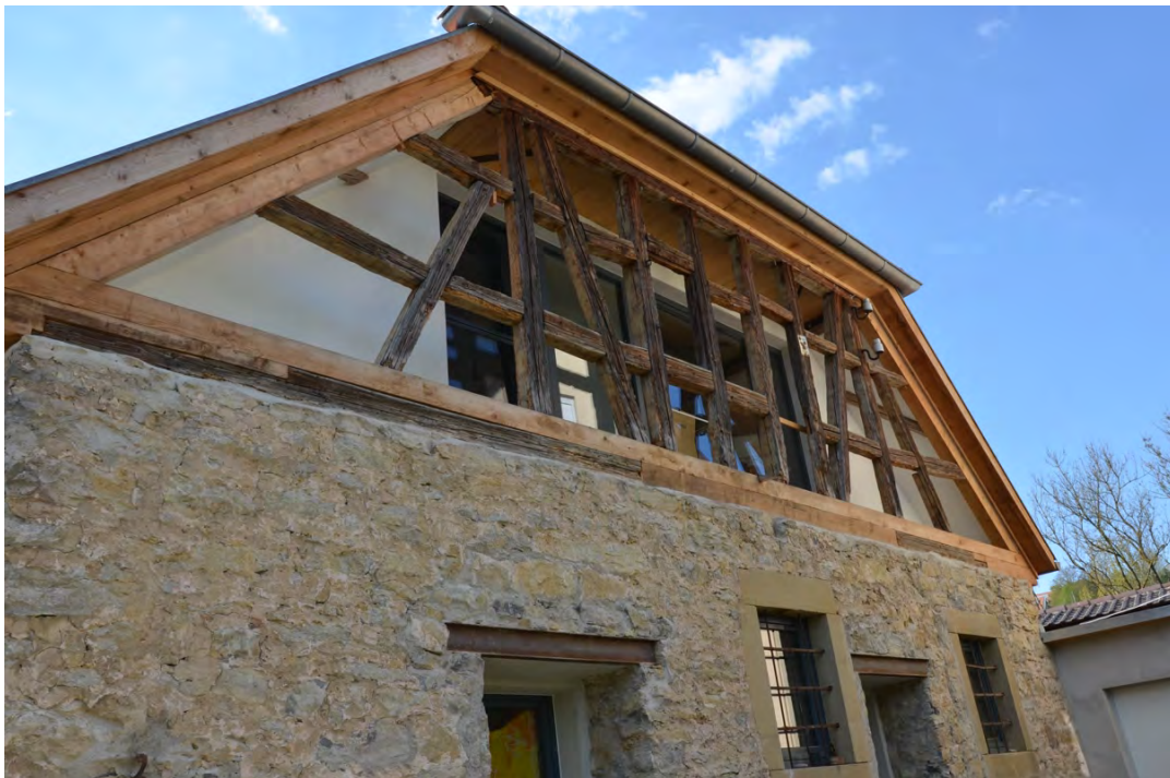
Abbildung 26: Außenansicht des Ostgiebels nach dem Abschluss der Arbeiten.

Der im Dachgeschoß realisierte liegende Dachstuhl hatte zur Zeit der Erbauung den Vorteil einer Tenne ohne störende Tragstrukturen. Auch dieses kam bei der Umgestaltung des Dachbereichs der Planung zu gute. Neben der weiterhin sichtbaren Struktur mussten lediglich zwei verstärkende Stützen eingezogen werden, die dem nun deutlich schwereren Dachstuhl Rechnung tragen.