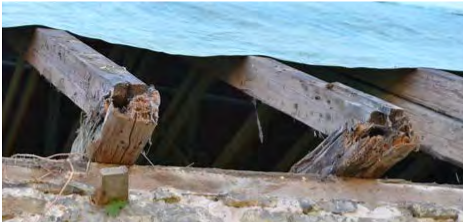
Abbildung 3: Verfaulte Balkenenden.