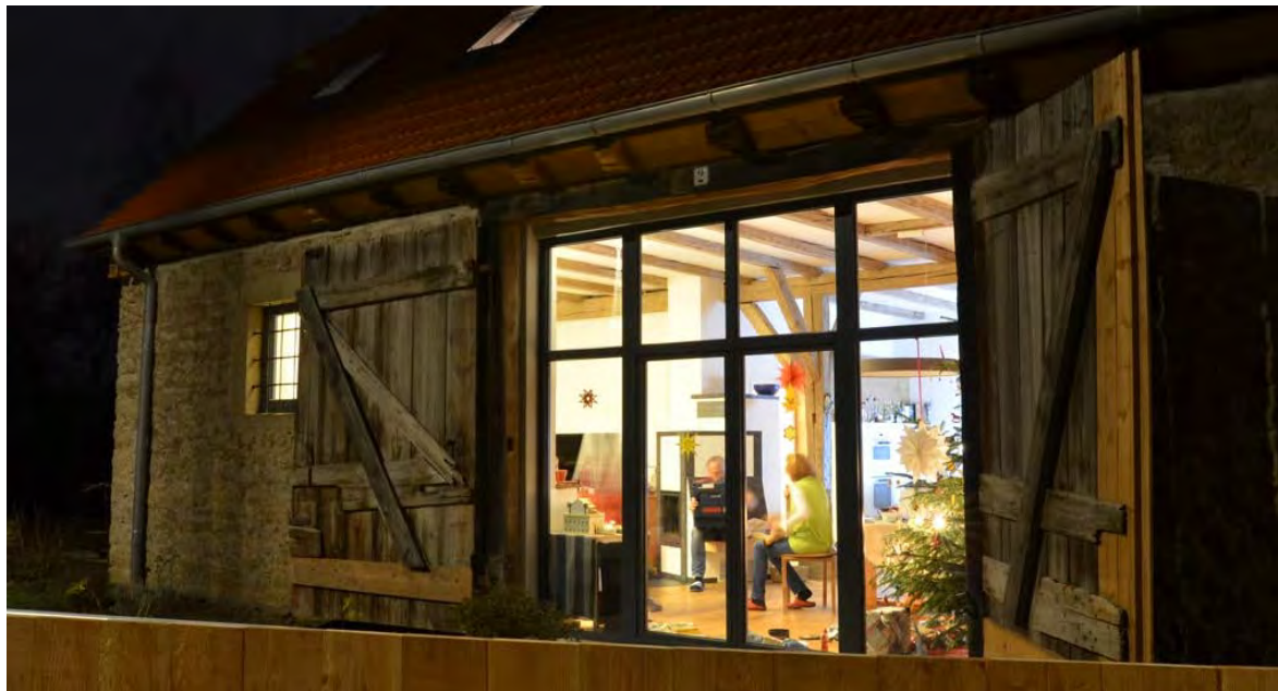
Abbildung 14: Blick von Außen in den Wohn-Ess-Bereich durch das alte Scheunentor

Die bereits als Scheune vorhandene Aufteilung in ein Erdgeschoss und einen Dachgeschoss wurde beibehalten. Im Erdgeschoss sind die Bereiche Wohnen, Essen und Kochen untergebracht. Der große, L-förmige Wohn-Ess-Küchenbereich nimmt die Großzügigkeit der alten Scheune auf und lässt durch das große verglaste Scheunentor den neuen Verwendungszweck transparent werden. Dies lässt das Familienleben über die Grenzen des Gebäudes hinausgehen. Diese Offenheit wird zusätzlich unterstrichen durch eine Raumhöhe von 3,2m im Erdgeschoss. Ebenso konnte durch das offene Konzept erreicht werden, dass die beiden Tragsäulen samt der Sandsteinsockel in den Wohn-Essbereich integriert sind und ebenfalls von Außen durch das Scheunentor sichtbar bleiben. Gleichermäßen sind alle Tragbalken offen geblieben und unterstreichen die Einfachheit der damaligen Konstruktion. Ebenso sind die alten Scheunentore weiter vorhanden und an ihrem historischen Platz. Sie werden weiterhin als eine Art übergroßer „Fensterladen“ genutzt.