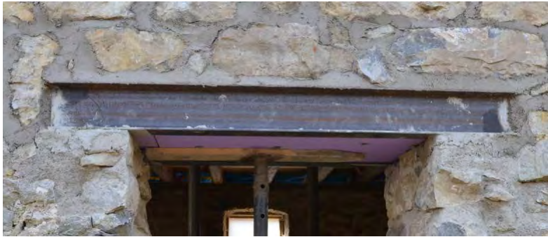
Abbildung 19: Stahlsturz über Wanddurchbrüchen.