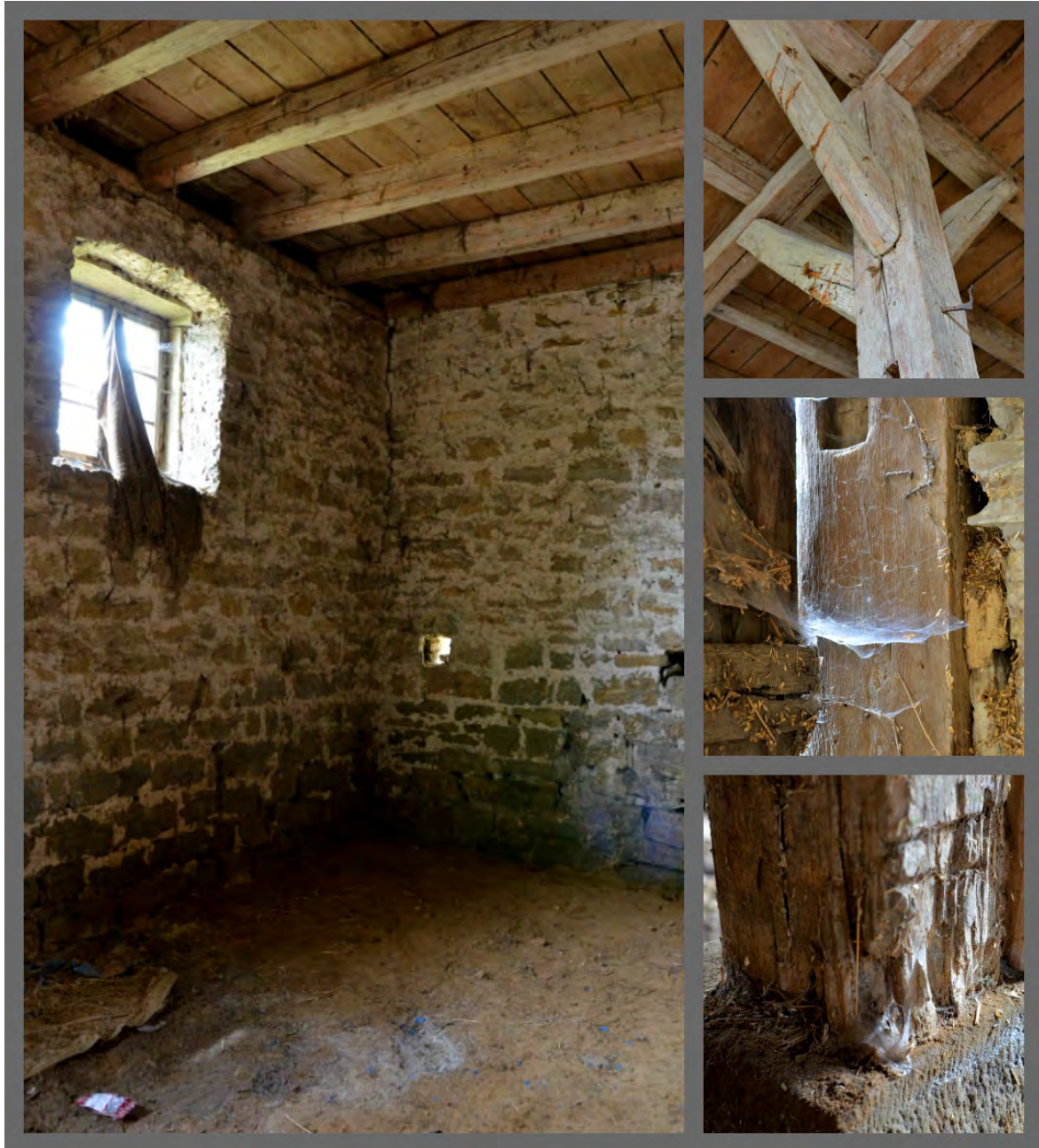
Abbildung 2: Urzustand bei Übernahme des Gebäudes von Innen, Bodengeschoß.

Vor Baubeginn wurde eine Vielzahl von baulichen Herausforderungen festgestellt (Fotos dazu jeweils dann im spezifischen Bauabschnitt). Zunächst zeigte sich, dass der Dachstuhl – insbesondere auf der Nordseite – angefault war und daraus entstandene Schäden über längere Zeit nicht behoben worden waren. 50% der Z14 Dachziegel wiesen defekte Auflagernasen auf. Ausbesserungen waren nicht vorgenommen worden. In das Gebäude bereits an mehreren Stellen hineingewachsene Bäume und andere Pflanzen hatten der Substanz zusätzlich zugesetzt. Weiter war über die Jahre bei Starkregen Hangwasser durch das Scheunentor in das Innere der Scheune gelangt und hatte den Lehm Boden im Inneren infolge mangelnder Entwässerung stark aufgeweicht. Das auf einem Lehmbankett basierende Fundament des Stalles hatte sich an der südlichen Hauswand gesenkt und bereits zu großen Rissen geführt, die nach oben hin auseinander klafften. Die Außenmauern des Stalles zeigten an vielen Stellen Löcher auf oder durch Beton- und Ziegelauffüllungen notdürftig vorgenommene Reparaturen.