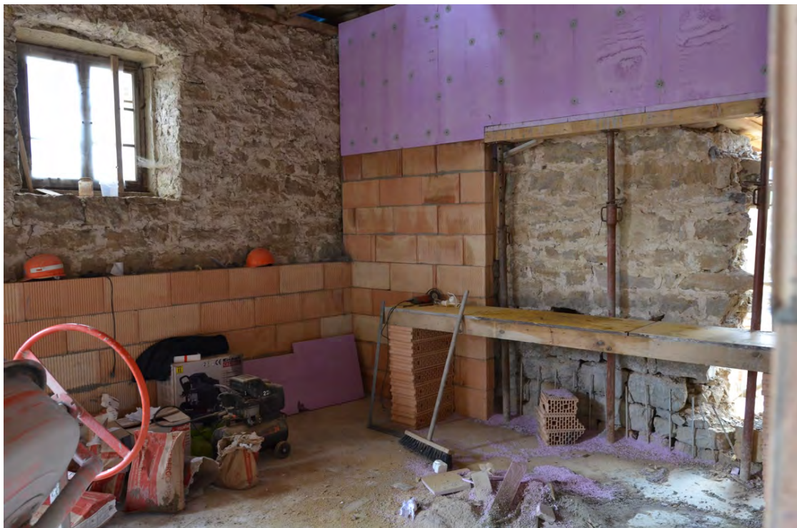
Abbildung 11: Statische Absicherung während der Erstellung der Fensterdurchbrüche in der Westwand.

Eine der größten Herausforderungen stellte die Umsetzung der Fenster- und Türdurchbrüche durch das z.T. 65cm dicke Bruchsteinmauerwerk dar. Insbesondere die schwer einzuschätzende statische Tragfähigkeit einzelner Bereiche führte zu aufwändigen Stützbetonierungen im Innenbereich (Abb. 11).