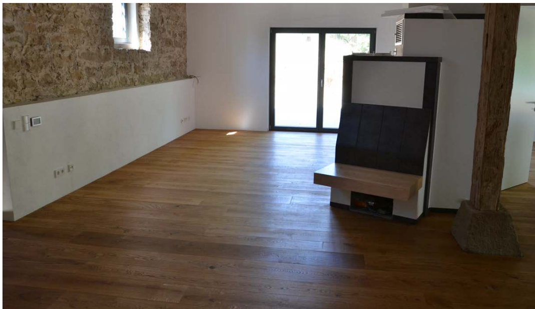
Abbildung 16: Blick nach Westen in den Wohnbereich.