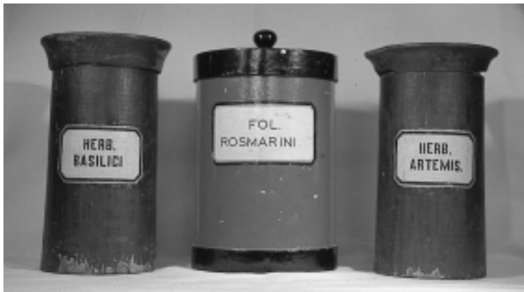
Drogenstand- gefäße aus Holz und Pappe

Eine solche Apotheke führe ich. Und ich führe sie mit Freude, weil sie meinem Verständnis des Apothekerberufes und meiner Situation einer Innenstadt-Apotheke in einem denkmalgeschützten Haus entspricht: Ich möchte das individuelle Erscheinungsbild meiner alten Apotheke bewahren, ich