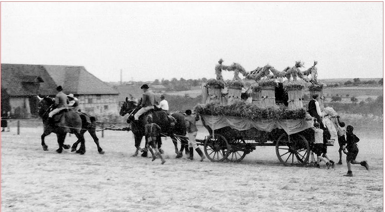
Unbesetzter Erntewagen beim ersten Nachkriegsschäferlauf 1947. In flottem Tempo geht's vom Festplatz auf der Hardt zurück in die Stadt. Kinder rennen hinterher, um sich anzuhängen oder aufzusitzen. Hinten die Rückseite des Bauernhofs Wyrich, Schillerstraße 2

Namen: David Zechmeister