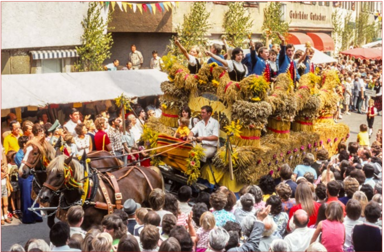
Erntewagen 1973 auf dem Marktplatz. Ein längerer Wagen ermöglichte wieder vier Garben pro Längsseite.