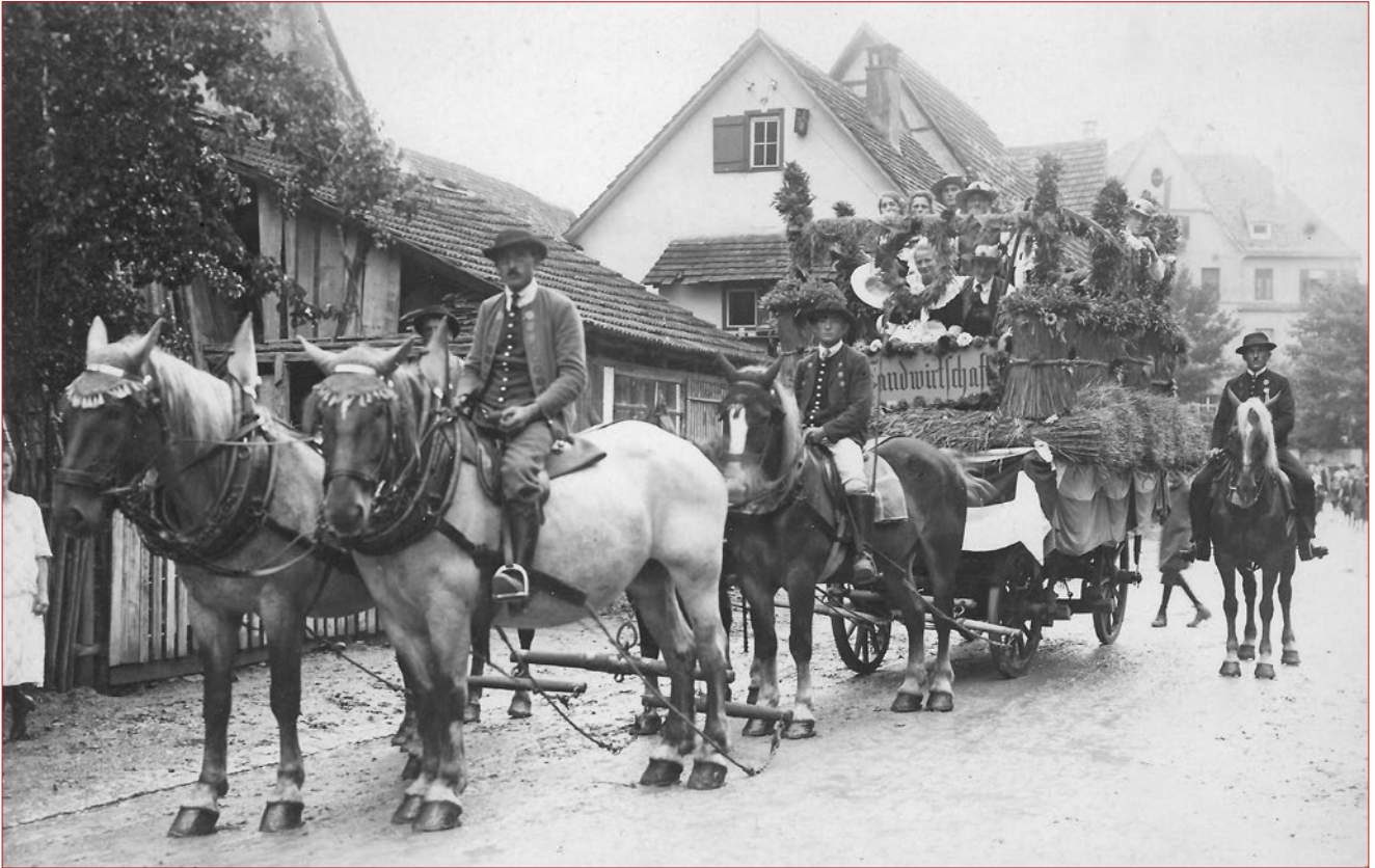
Erntewagen 1927 mit Begleitritter vor Haus Schlatterer (Helenenstraße 4) auf der lediglich gewalzten Straße