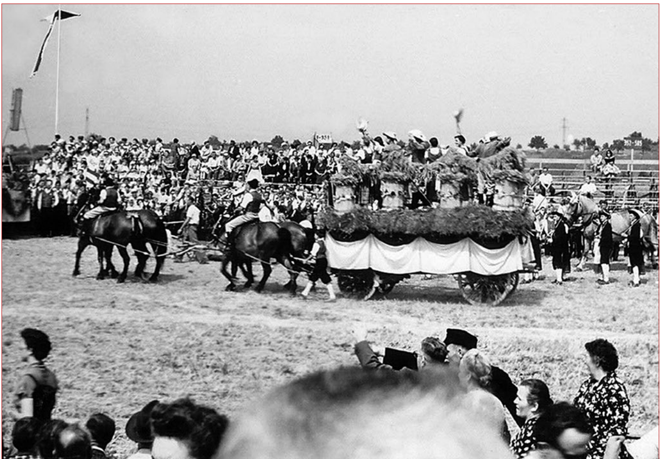
Erntewagen 1955 bei der Einfahrt aufs Stoppelfeld auf der Hardt