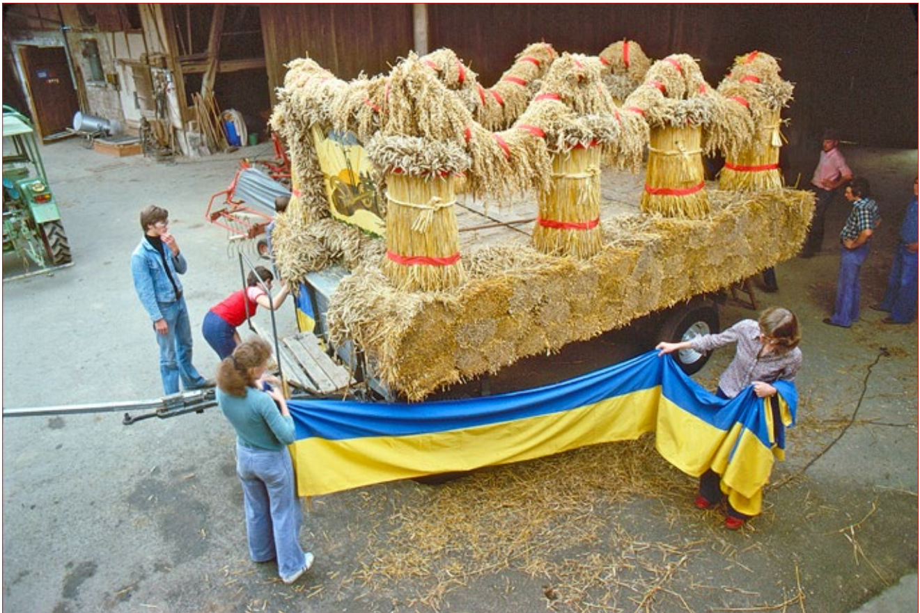
Aufbau des Erntewagens 1977 im Hof von Heiner Bäßler. Für die dicken Garben sind zahllose Weizenhalme erforderlich. Hafer nimmt die Landjugend für die Girlanden. An der Stirnseite das „Bauernstand“-Schild von 1947. Unten rum wird der Wagen mit den Stadtfarben eingekleidet. Zuletzt erfolgt der Blumenschmuck.