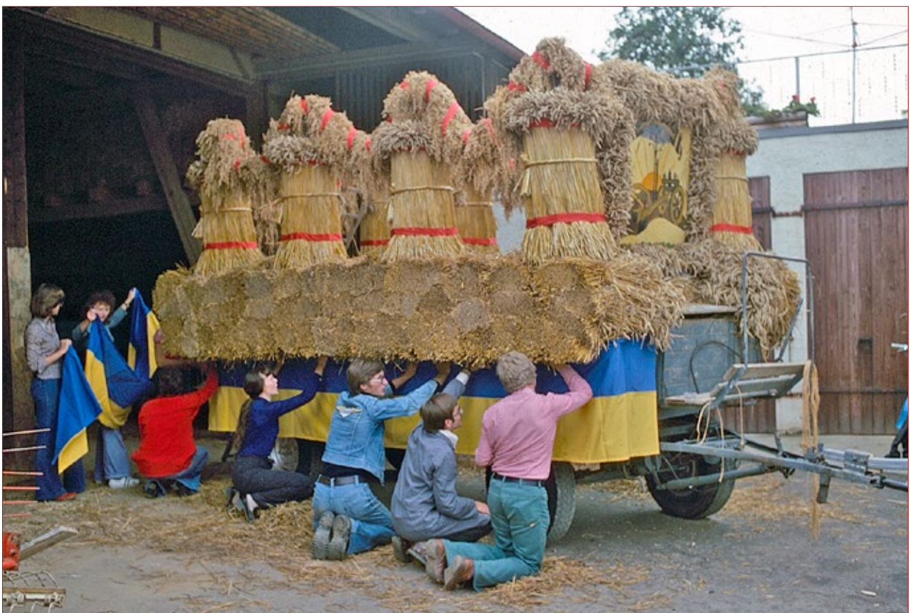
1977 werden die Stadtfarben in der richtigen Abfolge angebracht, was nach den 1960er Jahren selten vorkam.