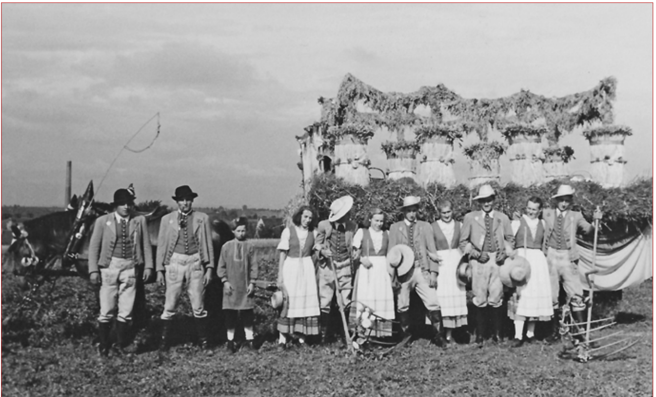
Vierspänniger Garbenwagen mit Reitern, Bremser und vier Paaren als Besatzung vermutlich 1951 beim Festplatz am Münchinger Weg