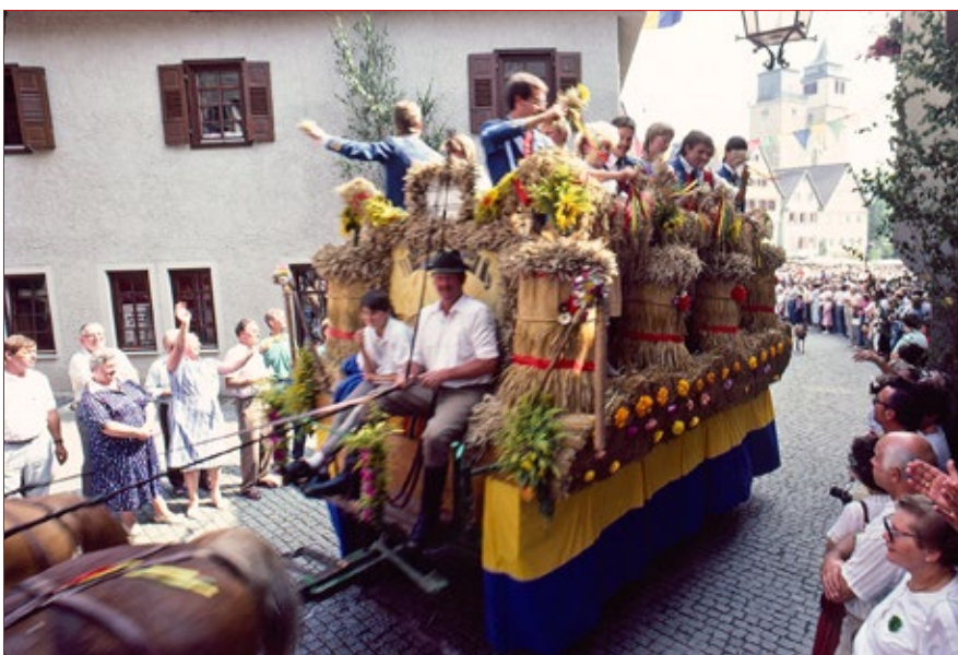
Erntewagen 1987 vor reichlich Publikum auf dem Marktplatz und in der Schlossgasse (unten). Hier mit rechteckigem Landjugend-Täfele