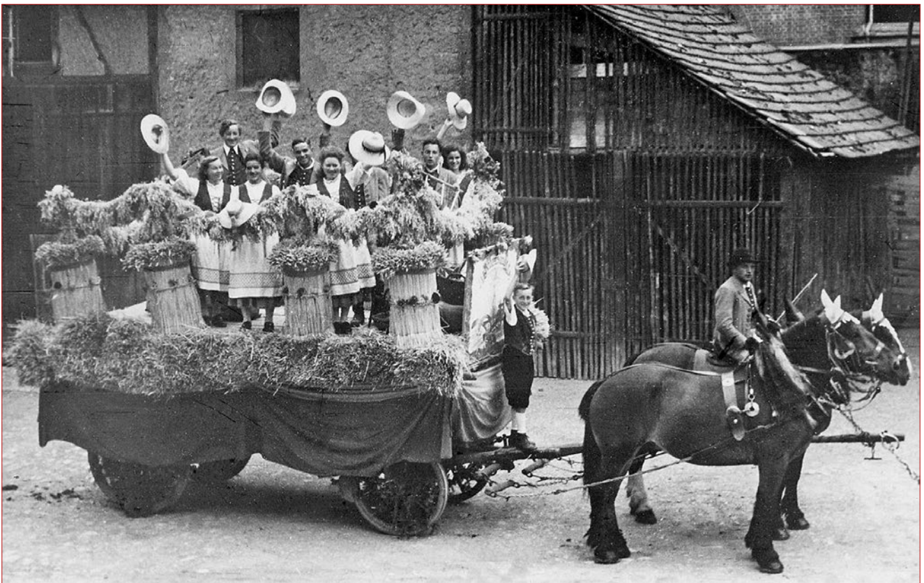
Die Gruppe von 1949 ist aufgestiegen und schwenkt die Hüte. Der „Migga-Bua“ durfte während der Fahrt sicher nicht auf der Deichsel stehen bleiben.