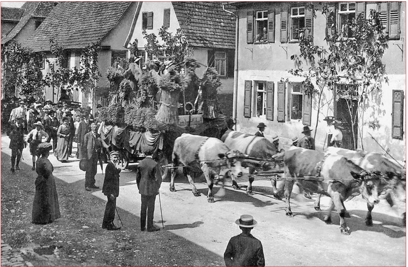
Vier Ochs ziehen den Erntewagen durch die mit Birken („Maier“) geschmückte Bahnhofstraße (Ecke Nonnengärten) zum Festplatz Auf Landern. Das Ochsengespann von 1910 blieb bis heute einmalig.