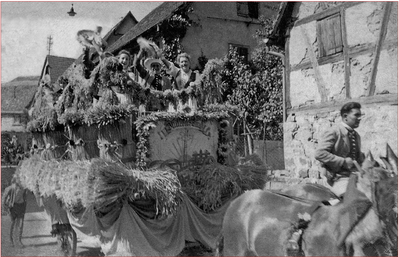
Erntewagen in den 1950er Jahren im Festzug in der Finsteren Gasse