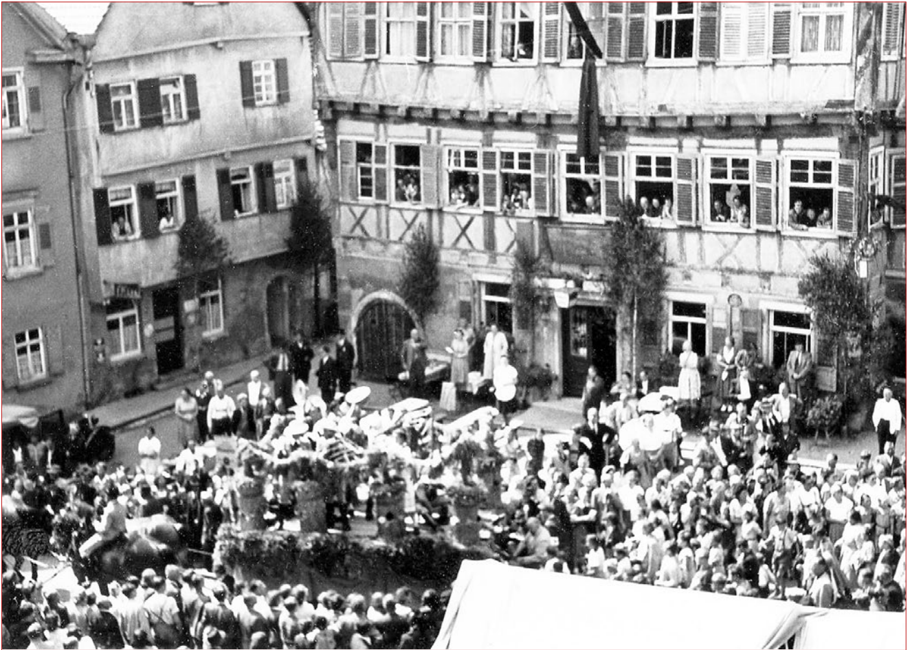
1951 im Festzug vor der Krone, die noch ihr Kellertor und das Schäferlauf-Schild über dem Eingang hat